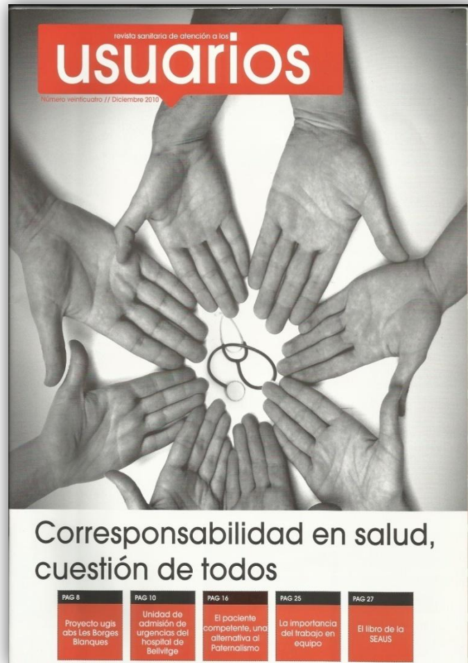
Modelo de una portada de la Revista de la SEAUS

El Grupo de Comunicación de la SEAUS, encargado de la Revista Atención al Usuario y del mantenimiento de la Web de la SEAUS trabaja desde este año 2011 coordinado estrechamente con la Secretaría de la SEAUS, que está actualmente ubicada en Palma de Mallorca en Baleares.