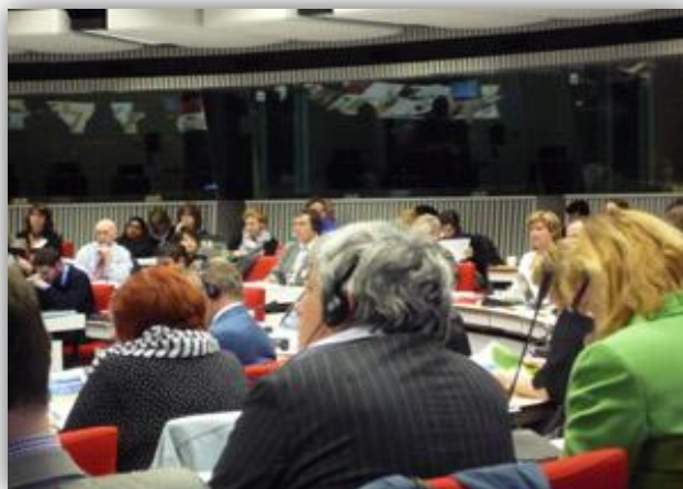
Presentación del Estudio en el European Patients’ Rights Day en Bruselas