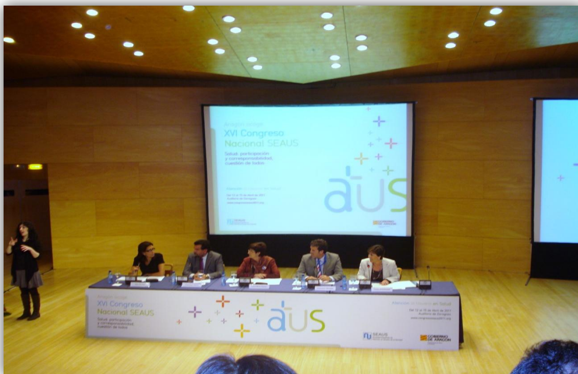
Inauguración del XVI Congreso de Zaragoza

La SEAUS ha realizado durante el año 2011 dos Jornadas en las Comunidades del País Vasco y Cataluña.